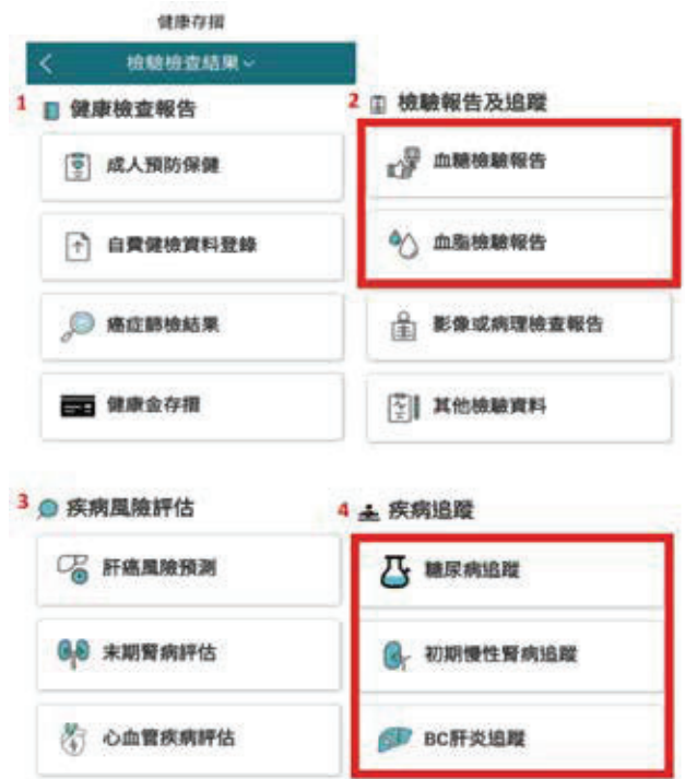
圖二 新增檢驗檢查結果

解答： 中央健康保險署自103年9月推出「健康存摺」，已獲列為行政院網路施政六大亮點之一，「健康存摺」係將民眾就醫資料，透過安全的申請程序，提供給民眾，落實知的權利，以促進國人自我照顧能力。自104年6月30日增加開放「檢驗（查）結果資料」（圖二）、「影像或病理檢驗（查）報告資料」及「出院病歷摘要」供下載，幫助國人管理自己