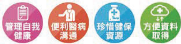
圖一 健康存摺對我有什麼好處

最新說法卻認為，主管機關為衛福部，未來 不排除找衛福部進一步了解釐清 。也就是…官署又再互踢皮球、找羔羊？」